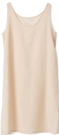
ちりめんアンダードレス 19,800円 (税込)