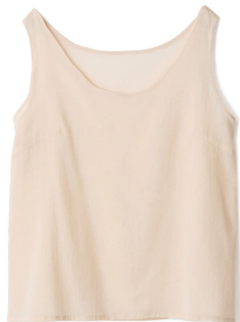
ちりめんタンクトップ 13,200円 (税込)

素材本来の健やかさが残る、無染色のオーガニックコットンで、日本の酷暑を快適に乗り切る必需品をご提案いたします。