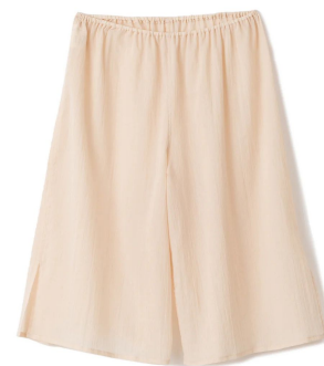
ちりめんペチパンツ 17,600円 (税込)