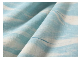
天然藍を原料にした笹の葉プリント

新登場の「笹の葉シリーズ」は、コレクションテーマの「雨土」をイメージし、藍染プリントのブルー、と五倍子染プリント（※1）のグレーを施したシリーズです。涼しげなオーガニックコットンのガーゼに、さらさらと笹の葉がそよぎます。