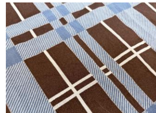
“藍×柿渋”のチェック柄

大昔から受け継がれた伝統色「藍と柿渋」、天然染料ならではのチェック柄を、ぜひお楽しみください。