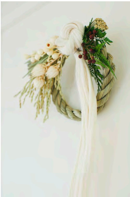
お正月飾りキット 価格：3,630円（税込）