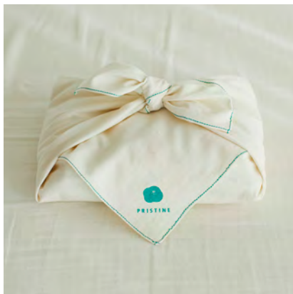
2022年 着衣はじめセット 眠衣（パジャマセット） 価格：22,000円（税込）