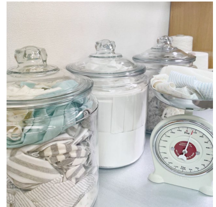
プリスティン本店にて、 残布・残糸・残紙の量り売りをスタート！

これまで同プロジェクトのなかでも再生できなかった残布・残糸・残紙を、プリスティン本店にて販売いたします。アイデア次第で宝物に変わっていくものづくりをお楽しみください。みなさん一人ひとりがアーティスト。表現していただいた作品は今後ウェブサイト等で紹介させていただく予定です。プリスティンはお客様とともに、産廃ゼロを目指して参ります。